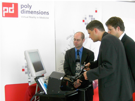
Training am Simulator

Gemeinsam mit dem Institut für Simulation und Graphik der Universität Magdeburg wurden Schnittstellen definiert, um eine Einbindung von Modellen und Falldaten zu einem späteren Zeitpunkt aus dem "Liver Surgery Trainer" in den Laparoskopiesimulator potenziell zu ermöglichen. Ebenso wird es möglich sein, Evaluationsdaten zwischen den Systemen zu exportieren, daher wurde als flexibles Austauschformat XML gewählt.