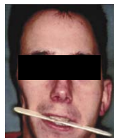
Vor der Operation

Komplexe chirurgische Eingriffe setzen eine detaillierte Planung voraus. Das Heikendorfer Unternehmen nordcom medical systems GmbH unterstützt Mund-, Kiefer- und Gesichtschirurgen sowie Orthopäden, Unfallchirurgen und Implantathersteller mit computergesteuert gefertigten, patientenindividuellen anatomischen Modellen für die Operationsplanung. Auf der Basis hochauflösender Computertomographien, die das Operationsgebiet erfassen, entstehen mit digitaler Präzision Kunststoffmodelle, an denen der Chirurg den vorgesehenen Eingriff im Detail planen, optimieren und simulieren kann.