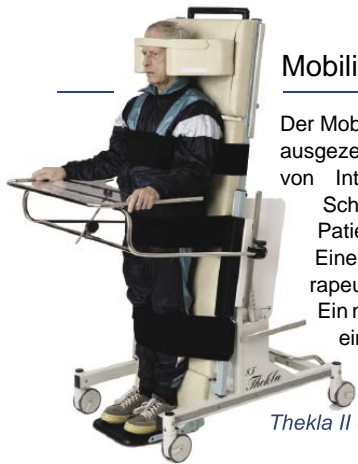
Thekla II 85° mit Person

und gibt Sicherheit. Durch die 85°-Stehposition lässt sich ein Stehtraining durchführen, was die Stabilität der Knochen, Muskeln und Gelenke fördert. Der Kreislauf wird trainiert. Es wird die Gleichgewichtsreaktion des Körpers und die Wahrnehmungsschulung aktiviert. Die wichtige axiale Belastung der Wirbelsäule dient der Tonusregulation und Körpersymmetrieförderung (Rumpfkontrolle).